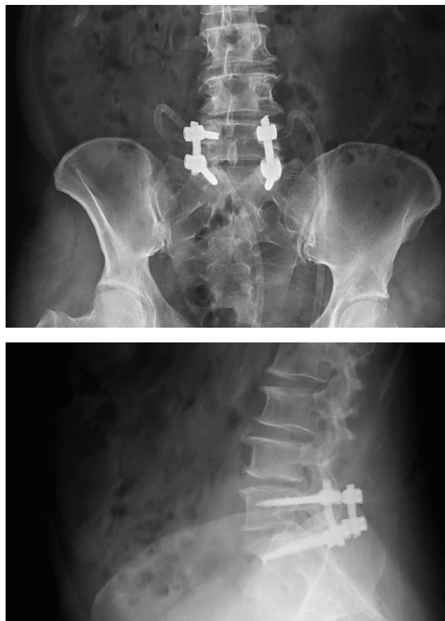
Рис. 4. Контрольные спондилограммы пациентки С.

После этапа декомпрессии сосудисто-невральных структур визуально дуральный мешок на всем протяжении расправился, без признаков сдавления. В связи с тем, что резекция суставной фасетки приводит к нарушению биомеханики заднего опорного комплекса на уровне L_{IV}-S_1 , с возникновением сегментарной нестабильности проведен этап ригидной задней транспедикулярной фиксации позвоночно-двигательного сегмента на уровне L_{IV}-S_1 4-винтовой транспедикулярной системой под рентгеноконтролем. На контрольных интраоперационных рентгенограммах стояние металлоконструкции удовлетворительное (рис. 4). В зону хирургического вмешательства подведен активный дренаж. Рана послойно ушита наглухо. Асептическая наклейка.