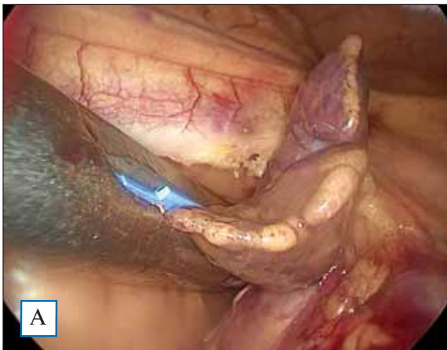
Рис. 1. Интраоперационная фотография: захват основания ушка левого предсердия сшивающим аппаратом (А); культя ушка левого предсердия (Б)