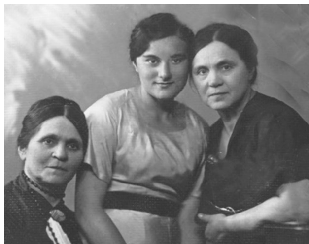
Нина Давидовна с мамой и тетей