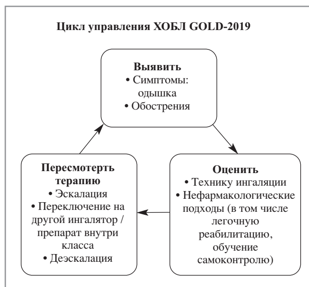
Рис. 1. Цикл управления ХОБЛ [6].

В руководстве GOLD-2019 также подчеркивается, что эффективное ведение пациентов со стабильной ХОБЛ базируется на регулярной индивидуальной оценке выраженности симптомов (одышки) и риска обострений. Это позволяет с учетом текущей базисной терапии определить дальнейшую стратегию. Для достижения и поддержания контроля ХОБЛ базисная медикаментозная терапия может увеличиваться, поддерживаться, уменьшаться в объеме (за счет отмены ингаляционных кортикостероидов) или меняться в связи со сменой ингалятора или препарата внутри одного класса. Такой подход помогает регулировать лечение, избегая как недостаточного, так и чрезмерного медикаментозного воздействия [2, 6]. Возможность контролируемого течения ХОБЛ без увеличения объема фармакотерапии важна как с фармакоэкономической точки зрения, так и с точки зрения повышения комплаентности больного. Правильная техника ингаляции, приверженность пациента