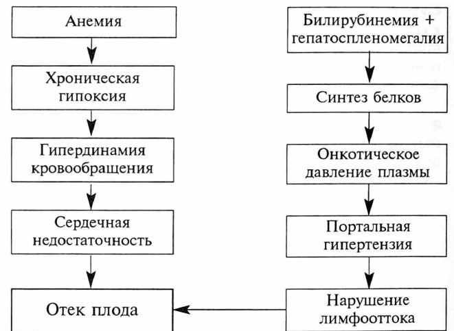
Рис. 2. Механизм развития отека у плода

жение буферных резервов крови, повреждение эндотелия капилляров и развитие хронической гипоксии. На фоне хронической гипоксии и ацидоза возникает компенсаторное увеличение сердечного выброса и минутного объема, приводящее к гипертрофии миокарда и постепенному развитию сердечной недостаточности, и, как следствие, к повышению центрального венозного давления. Его повышение затрудняет ток лимфы по магистральным лимфатическим сосудам, вызывая нарушение оттока интерстициальной жидкости и увеличение ее онкотического давления. Весь комплекс происходящих патологических процессов вызывает накопление жидкости в тканях и серозных полостях плода, что клинически проявляется развитием у него генерализованного отека и при отсутствии соответствующего лечения, приводит к внутриутробной гибели плода (рис. 2).