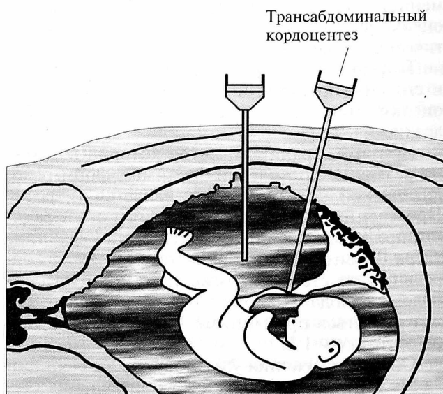
Рис. 3. Инвазивные методы

Отечная форма гемолитической болезни может развиваться уже в течение второго триместра беременности, и в этом случае практически 100% таких плодов погибают антенатально до 30 недели беременности. Тем не менее даже при отечной форме плода показатели красной крови могут быть успешно скорректированы. Однако в наших наблюдениях при проведении переливания только отмытых эритроцитов донора, несмотря на полную нормализацию показателей крови у плода, отек разрешился после первого переливания лишь у 33% плодов.