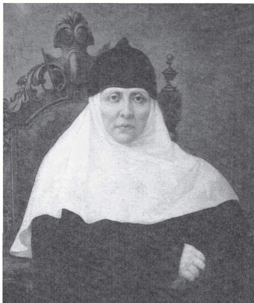
Рис. 1. Инокания Анастасия (в миру великая княгиня Александра Петровна)

дворянскому роду Давыдовых. Там не только лечили больных, но и готовили средний медицинский персонал. Известны своей лечебной деятельностью и женские православные монастыри в Западном крае. В числе первых таковых была киевская обитель великой княгини Александры Петровны.