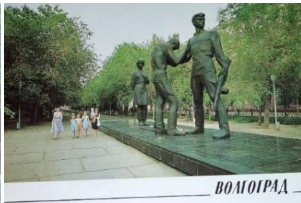
Рис. 3. Памятник комсомольцам-защитникам Сталинграда, 1989 г. [3]

Событийный ряд продолжают открытки, датированные 1979 г. и 1981 г. Они заключают в себе информацию о значимом для Волгограда и для всей страны монумента, главной высоте России, которая своими величественными основами подчеркивает величие подвига советских солдат. На зафиксированных кадрах представлены толпы людей, идущих к подножию Мамаева Кургана. Это и есть трансляция и прямое отражения коллективной памяти граждан, сплоченной одной историей в рамках одного государства в городе, совершившем легендарный подвиг.