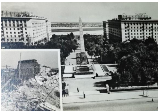
Рис. 8. Волгоград. Обелиск на братской могиле защитникам города, 1965 г. [1]

Завершают фоторяд открытки 1965 г. и 1973 г. с уже другим зафиксированным объектом культурного наследия. Это обелиск, возвышающийся над братской могилой в память погибших в Гражданской войне защитников Красного Царицына и память советских солдат, павших во время Сталинградской битвы. Почтовые карточки фиксируют образ величественной стелы и жителей города, выражающих дань памяти и уважения героям.