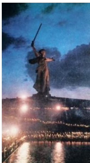
Рис. 4. Памятник – ансамбль «Героям Сталинградской битвы» на Мамаевом Кургане, 1979 г. [2]

Событийный ряд продолжают открытки, датированные 1979 г. и 1981 г. Они заключают в себе информацию о значимом для Волгограда и для всей страны монумента, главной высоте России, которая своими величественными основами подчеркивает величие подвига советских солдат. На зафиксированных кадрах представлены толпы людей, идущих к подножию Мамаева Кургана. Это и есть трансляция и прямое отражения коллективной памяти граждан, сплоченной одной историей в рамках одного государства в городе, совершившем легендарный подвиг.