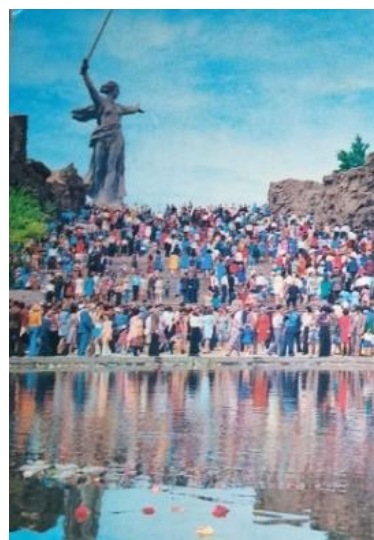
Рис. 5. Город-герой Волгоград. Мамаев Курган. Монумент «Родина-мать зовет», 1981 г. [4]