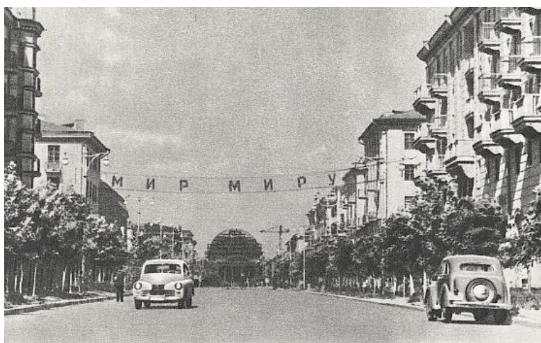
Рис. 1. Сталинград. Улица Мира, 1954 г. [6]

Улица Мира – уникальная улица в историческом центре города, целиком являющаяся охраняемым памятником истории и культуры. Это первая восстановленная после Сталинградской битвы улица города. Почтовая открытка 1954 г. зафиксировала ее живой и привлекательной, будто и не знающей военной разрухи.