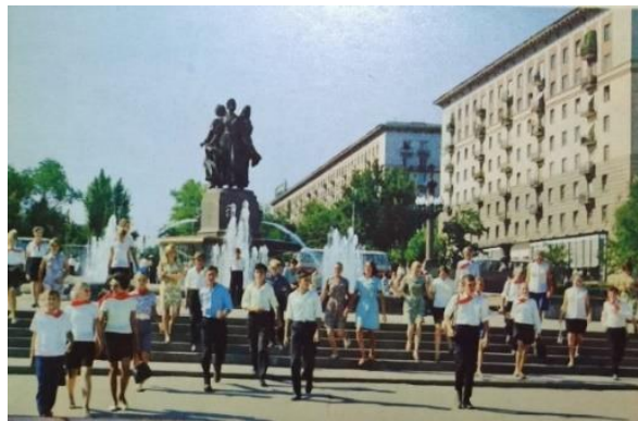
Рис. 7. Волгоград Фонтан «Дружба» на Центральной набережной, 1973 г. [5]

Завершают фоторяд открытки 1965 г. и 1973 г. с уже другим зафиксированным объектом культурного наследия. Это обелиск, возвышающийся над братской могилой в память погибших в Гражданской войне защитников Красного Царицына и память советских солдат, павших во время Сталинградской битвы. Почтовые карточки фиксируют образ величественной стелы и жителей города, выражающих дань памяти и уважения героям.