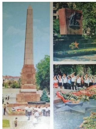
Рис. 9. Обелиск героям Красного Царицына, 1973 г. [5]

Представленные в работе почтовые открытки репрезентативны и информативны, поскольку транслируют образ Сталинграда/Волгограда даже на примере нескольких