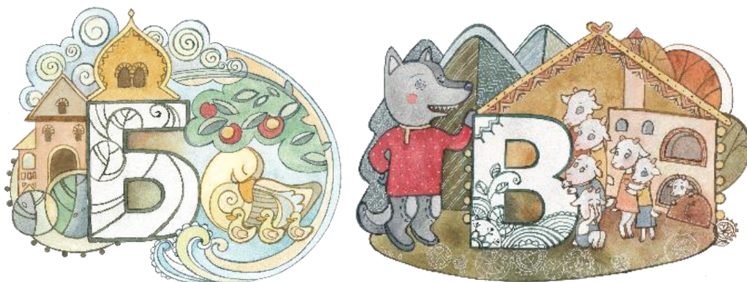
Рис. 6. Из ВКР Герасимовой Е. Эскизы в цвете к набору открыток «Азбука в открытках» по мотивам русских народных сказок»

Сложнее складывается процесс обучения магистров, завершивших обучение по программам бакалавриата. Причиной этому слабая подготовка по рисунку и живописи, так как в учебных планах бакалавров мало часов по данным, формирующим основные