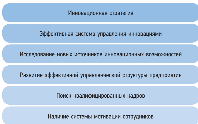
Рис. 1. Факторы успеха развития инноваций

На основе анализа данных крупных международных компаний, проведенного консалтинговой компанией McKinsey [2], выявлена существенная необходимость в перераспределении бюджетных средств компании на исследования и разработки в области инновационного развития (рис. 2). Из данного анализа следует, что большая доля высокоэффективных новаторов стараются перераспределить на исследования и разработки инноваций 5–20 % своего бюджета. Низкоэффективные новаторы перераспределяют в основном 0–5 %