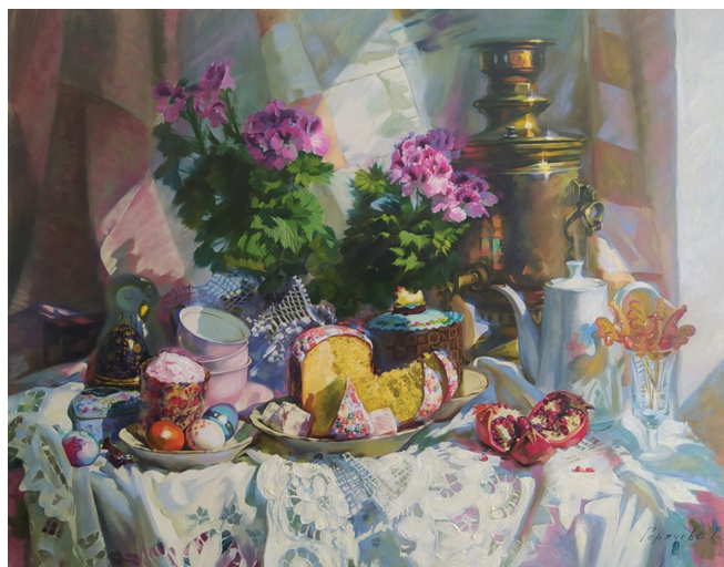
Рис. 3. С.Н. Горячева. «Пасха с петушками»

(рис. 2) изображен храм в контексте современной городской застройки; серый, пасмурный день, люди спешат по своим делам, а в центре всего этого — место спокойствия [2].