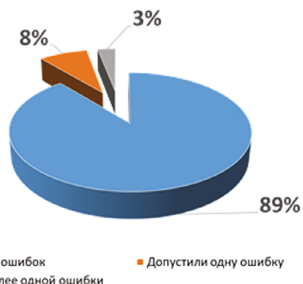
Рис. 3. Результаты опроса обучающихся 2 курса

Выводы. Изучены основные формы проявления «языка» кошек шотландской породы. Опрос обучающихся показал, что они понимают проявление форм «языка» кошек. Будущая профессиональная деятельность зоотехников и ветеринарных врачей связана с животными, поэтому знания о формах проявления «языка» животных имеют для них большое значение.