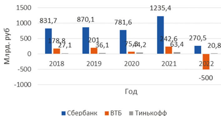
Рис. 3. Чистая прибыль банков за 2018–2022 годы

Выводы. Таким образом, результаты нашего моделирования во многом аналогичны показателям отчета ЦБ за 2022 год. Имеющиеся расхождения прежде всего связаны с неучтенным в модели санкционным давлением. В первой половине 2022 года банки столкнулись с серьезными трудностями в виде отключения от системы SWIFT, заморозки активов, закрытия и продажи дочерних компаний как внутри, так и за пределами страны. Это, безусловно, отрицательно повлияло на ключевые показатели деятельности. Однако Банк России приводит статистику, в которой очевиден рост анализируемых показателей, что в целом совпадает с прогнозом. Данное соответствие, а именно восстановление объемов кредитования, положительная динамика капитала банков и выход сегмента на небольшую прибыль, объясняют антикризисные меры ЦБ и политика самих коммерческих банков.