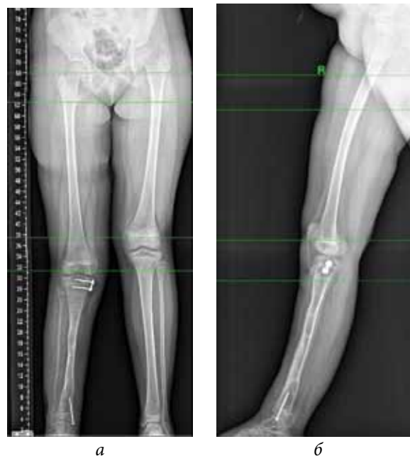
Рис. 6. Рентгенограммы пациентки после применения демонтажа АВФ и применения методики управляемого роста с целью коррекции рецидива деформаций: а — передне-задняя проекция; б — боковая проекция

G. Zhu et al. [9] сообщают о 11 случаях удлинения голени у пациентов с консолидированным ложным суставом. Во всех случаях также выполнялись остеотомия верхней трети костей голени и удлинение. По тексту статьи сложно судить о том, имелись ли только укорочение или также и деформация кости. Кроме этого, не ясно, чем был обусловлен выбор уровня остеотомии. Судя по представленным рентгенограммам, хирурги не ставили цель устранить все компоненты деформации, а стремились только удлинить сегмент. В публикации обращает на себя внимание также крайне высокий ИВФ — 63,1 дня/см. Полученный нами ИВФ ( 64,3 \pm 40,6 дня/см) мало отличается от приведенных выше. Столь высокие цифры ИВФ свидетельствуют о медленном созревании дистракционного регенерата, что вполне можно объяснить патологическим процессом, лежащим в основе данного заболевания.