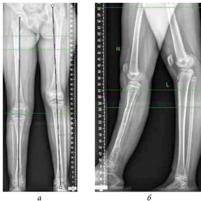
Рис. 7. Рентгенограммы пациентки после удаления пластинки и винтов по методике управляемого роста: а — передне-задняя проекция; б — боковая проекция

В литературе мы не нашли ни одной публикации, посвященной точности коррекции деформации, выбору уровня остеотомии(ий), лишь встречались упоминания о том, что остеотомия в зоне вершины деформации, чаще всего располагающейся на уровне консолидации ложного сустава, может привести к лизису концов костных фрагментов в месте остеотомии и, соответственно, к формированию ложного сустава [8].