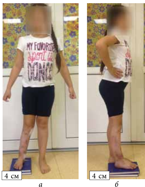
Рис. 5. Фотографии пациентки после применения демонтажа АВФ и применения методики управляемого роста с целью коррекции рецидива деформаций: а — вид спереди; б — вид сбоку

дес костей здоровой конечности с целью ее укорочения. Необходимо отметить, что в двух случаях из трех получены осложнения в виде ложного сустава.