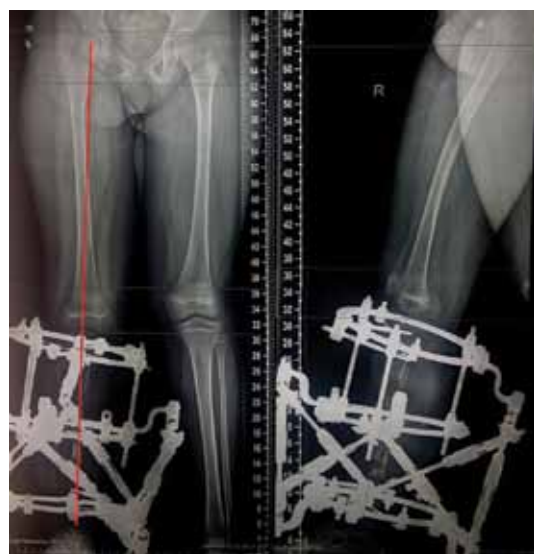
Рис. 4. Рентгенограммы пациентки с кВЛСКГ после выполнения коррекции деформаций костей правой голени: а — передне-задняя проекция; б — боковая проекция

позволяют достичь консолидации ложного сустава в достаточно высоком проценте случаев: от 75 до 85 % [1–3, 6]. Таким образом, можно утверждать, что данная проблема на настоящий момент не является столь актуальной. Однако лечение пациентов с врожденным ложным суставом костей голени не заканчивается на этапе консолидации ложного сустава. Известно, что в дальнейшем голень отстает в росте, возникают ее сложные многоплоскостные деформации. Лечение деформаций и укорочений голени на фоне консолиди-