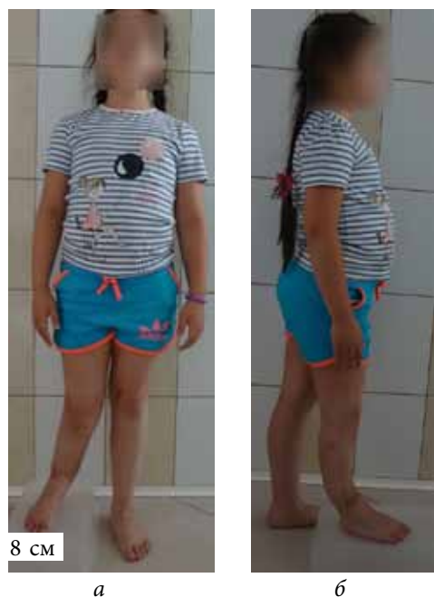
Рис. 1. Фотография пациентки с кВЛСКГ перед выполнением коррекции деформаций: а — вид спереди; б — вид сбоку