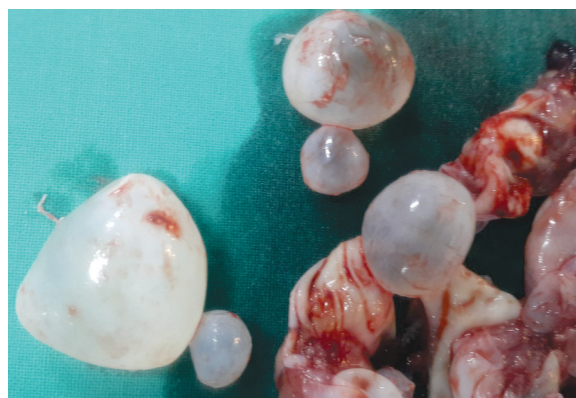
Рис. 2. Кисты, извлеченные из почки Fig. 2. Cysts retrieved from the kidney

Первичная гидатидная киста почки образовалась вследствие гематогенного распространения эхинококка после заражения хозяина. Пациентка была фермером, что связано с повышенным риском заражения. Заслуживают внимания симптомы со стороны мочевыделительной системы. В остальном болезнь протекала бессимптомно. Ультразвуковое исследование служит наиболее важным инструментом диагностики