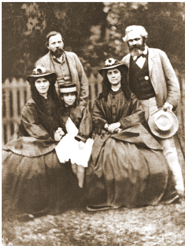
К. Маркс, Ф. Энгельс и дочери Маркса — Женни, Элеонора и Лаура

Маркс целиком сосредотачивает своё внимание на социальной науке, а именно на экономической истории капитализма, все работы по марксистскому пониманию естествознания принадлежат перу Ф. Энгельса, написаны в парадигме физической теории середины XIX в. и никаких новых открытий в естествознании не делают. Это добротные методологические работы, объясняющие основные принципы естественно-научного мышления и признающие приоритет естествознания перед всеми другими формами познания природы. Вместе с тем эти труды созданы, как отмечалось выше, при непосредственном участии Маркса, а главное — есть нечто общее, что в учении Маркса связывает науки о природе с наукой об обществе, — материалистический диалектический метод .